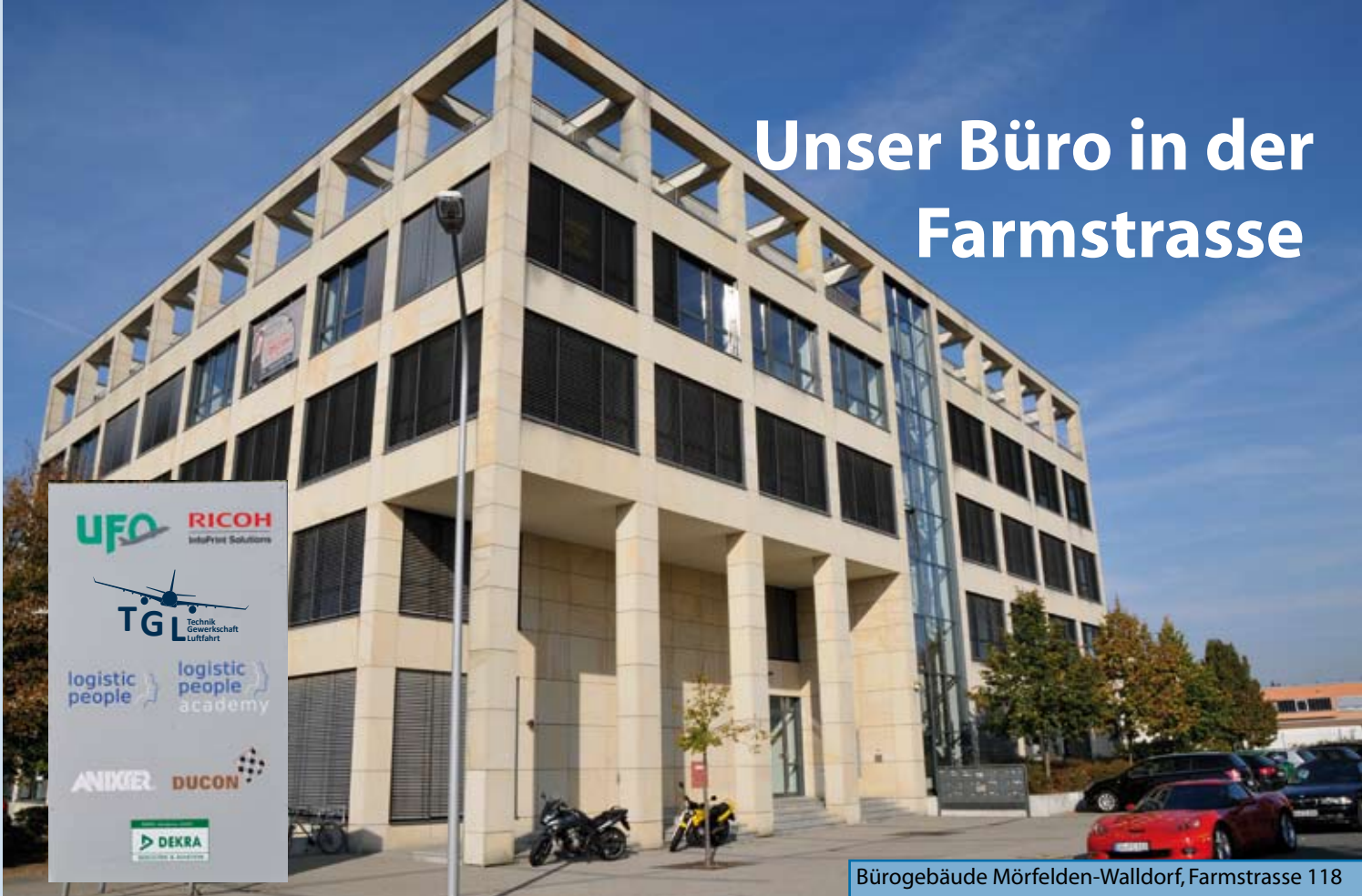
Bürogebäude Mörfelden-Walldorf, Farmstrasse 118