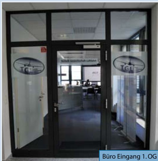
Büro Eingang 1. OG